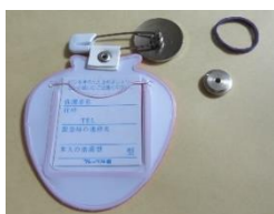
①小さいゴムを準備