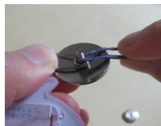
②穴に園章をはめ、その上からゴムを巻き付ける